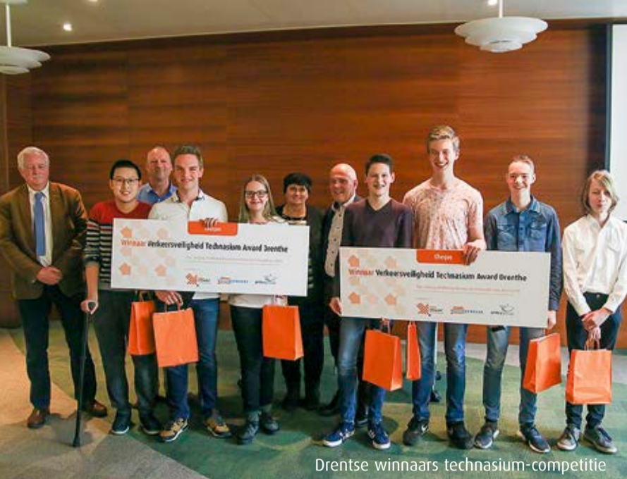
Drentse winnaars technasium-competitie