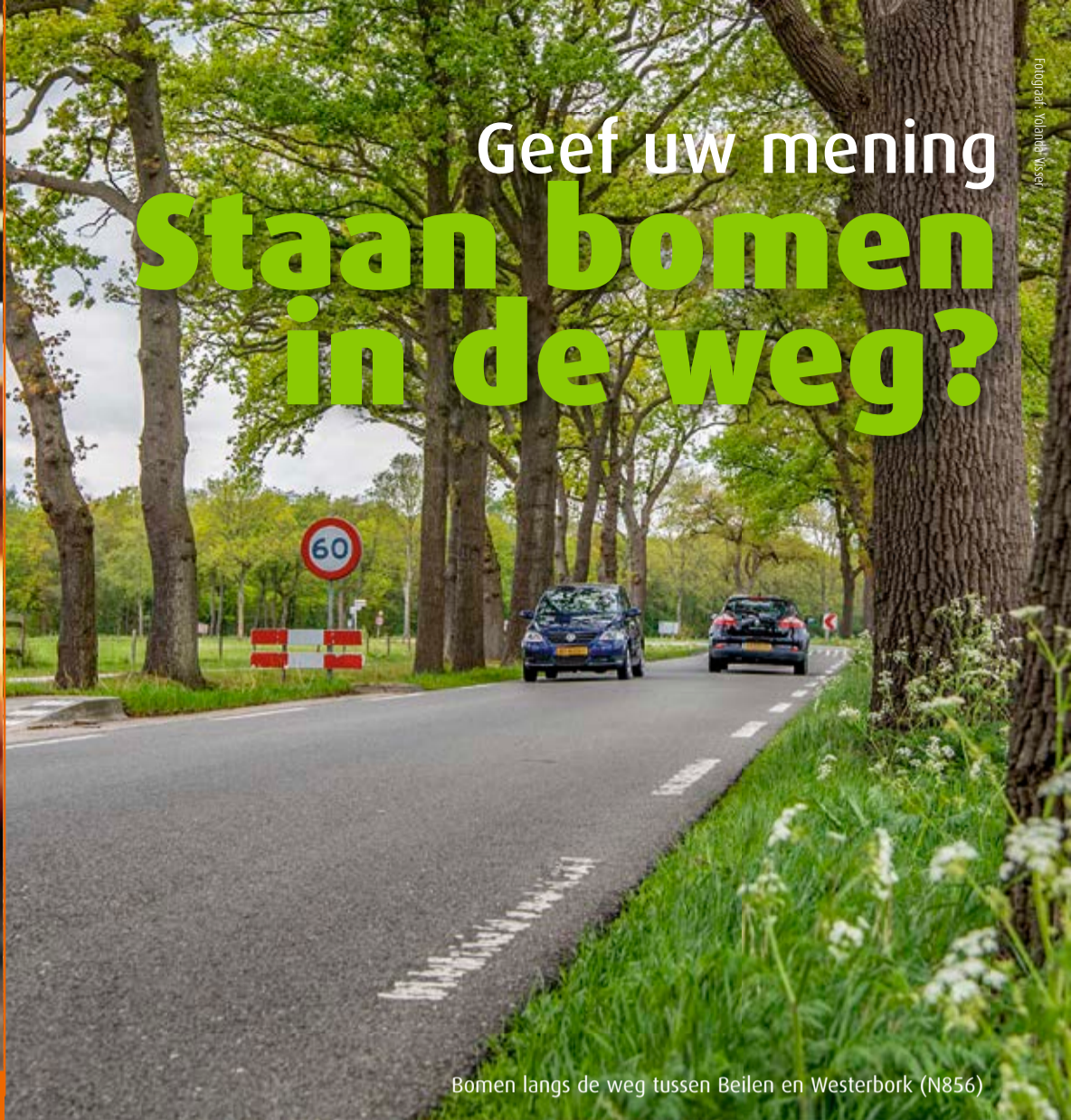
Bomen langs de weg tussen Beilen en Westerbork (N856)